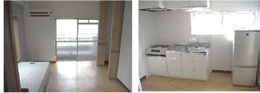
2F・3F リビング 2F・3F キッチン