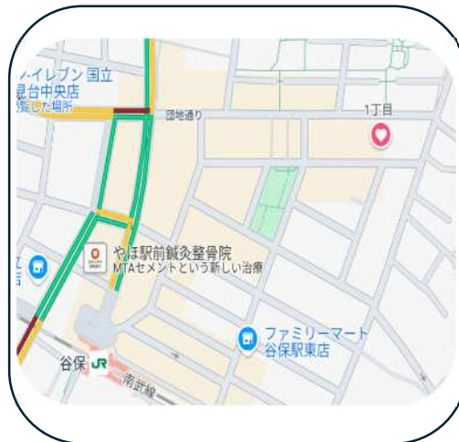
コレクティブハウスまでの地図

施設名 コレクティブハウスくにたち 所在地 東京都国立市富士見台 1-26-24 電 話 042(505)7822 FAX 兼用