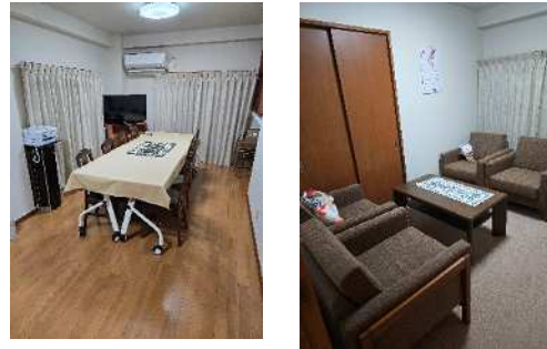
1F 共有リビング 1F 相談室